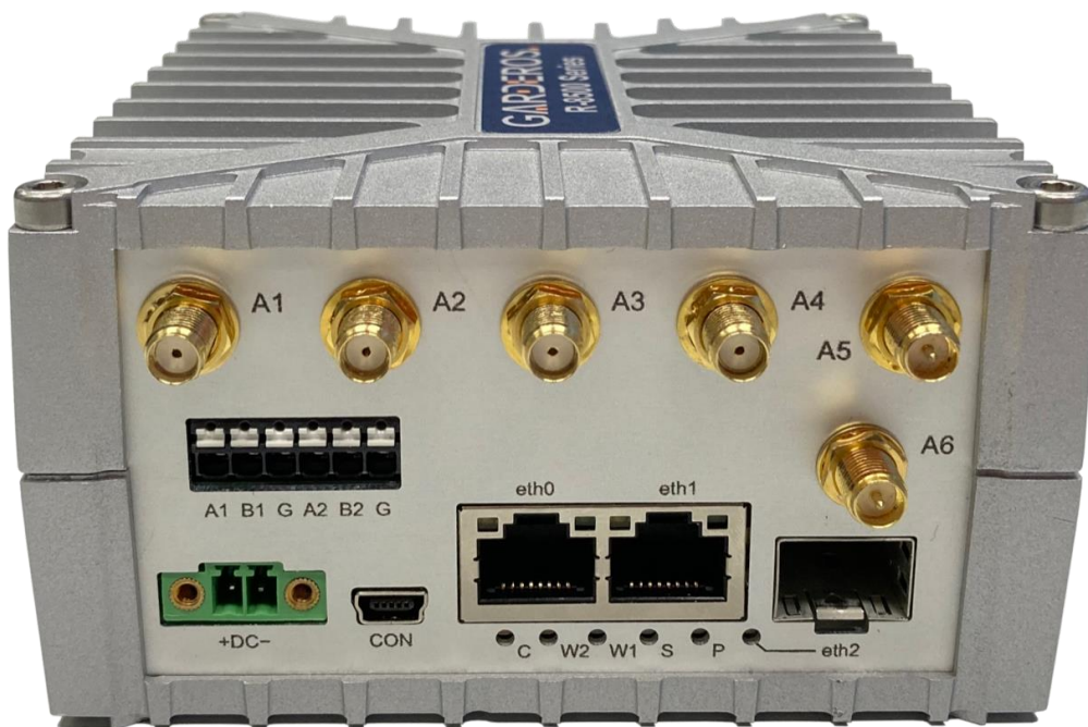
Abbildung 1: Garderos R-8500 Router für hohe Leistung und Edge Computing

Sichere und performante Konnektivität für professionelle industrielle Anwendungen in den Branchen Telekommunikation, Energie und Verkehr. Die Multifunktions-Router der Garderos R-8500 Serie liefern mobil und stationär maximale Bandbreite für datenintensive Anwendungen in rauen Umgebungen und an abgesetzten Standorten.